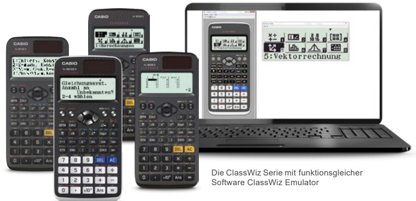
Die ClassWiz Serie mit funktionsgleicher Software ClassWiz Emulator